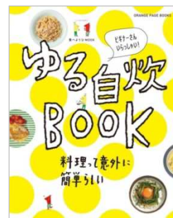
『ゆる自炊 BOOK』（2016年3月17日刊行）