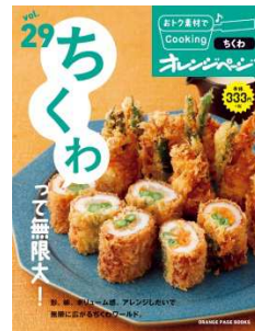
納豆 (2019年2月1日発売) 揚げ(2018年6月14日発売) ちくわ(2018年2月17日発売)

<このリリースに関するお問い合わせ先> 〒105-0004 東京都港区新橋 4-11-1 株式会社オレンジページ 広報室 遠藤 press@orangepage.co.jp Tel 03-3436-8421 Fax 03-3436-8434